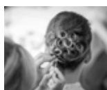
Hääkampaukset taidolla KAMPAAMO VIILHA