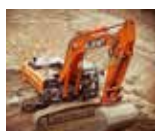
Tilaa meidät töihin! KÄIVURIJÄTKÄT