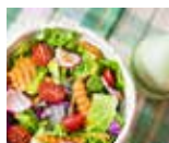
Raikkaat lounassalaatit LOUNASKAHVILA RUUSU