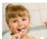
Terve suu sinulle HAMMASKLINIKKA KILLE