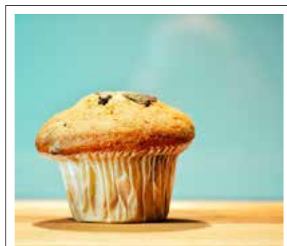
Herkulliset muffinssit 2,40 € Café Herkku

Reunapalkissa näkyy viisi eri tuotemainosta etusivulla ja kaikilla muillakin sivuilla.