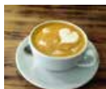
Suussa sulava lattekahvi 2,10 € CAFÉ HERKKU