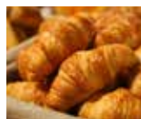
Uunituoreet croissantit 1,90 € CAFÉ HERKKU