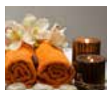
Rentoudu hieronnassa WELLNESS COMPANY